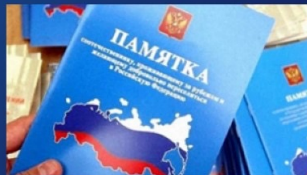
привлечение соотечественников из-за рубежа (от 300 тыс. руб. на 1 чел. + компенсация переезда и иные льготы)