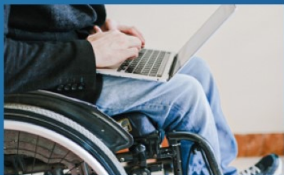
субсидии при трудоустройстве инвалидов (от 100 до 200 тыс. руб.)