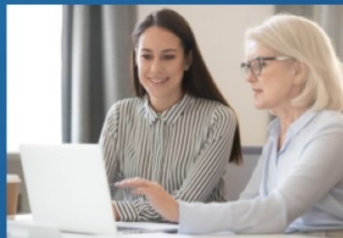
бесплатное профессиональное обучение