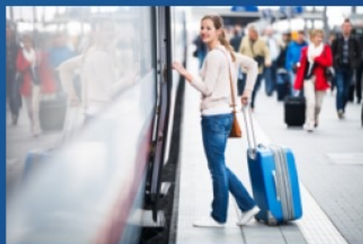
переезд и переселение (от 55 до 103 тыс. руб. + компенсация переезда и провоза багажа)