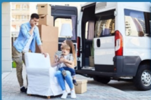
трудова́я моби́льность (до 1 млн руб.)